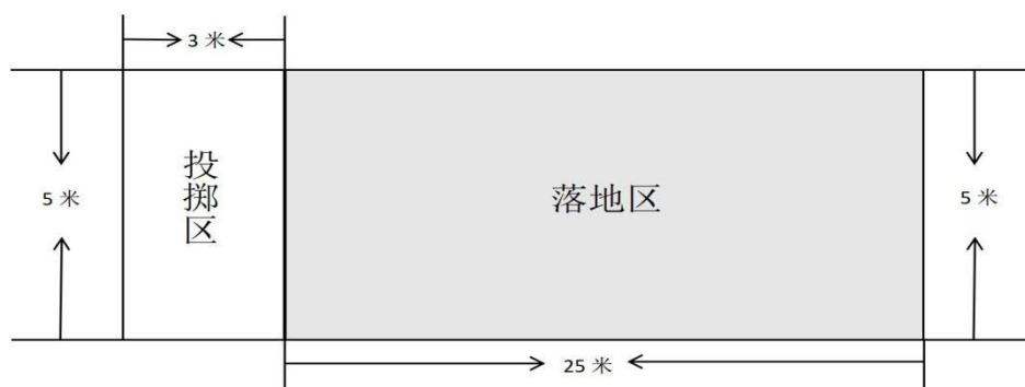
图 2 实心球投掷场地图

②落地区：考试在宽 5 米、纵向长 25 米的长方形场地内进行，场地边线和起掷线均用 5 厘米宽白线标定，边线线宽不包括在落地区域内，使用可产生明显落地痕迹的地面作为有效落地区。